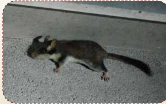
Une observation possible dans les habitations : un lérot « courant » sur un mur.

Tout type de donnée est important pour mieux connaître cette espèce classée « en danger critique d'extinction » en Bretagne (prenez des photos, conservez les cadavres jusqu'à récupération par l'association).