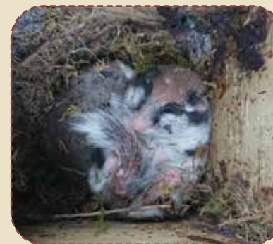
Lérot ayant choisi d'hiberner dans un niochir à mésange.