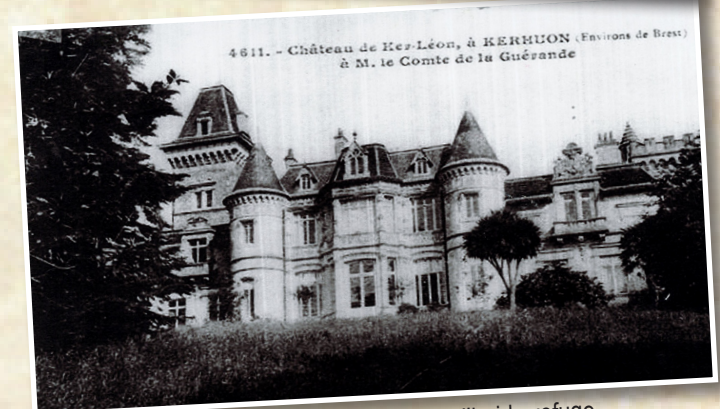
Le château de Ker-Léon, qui abrite aujourd'hui le refuge de l'Arche.

Renseignements et inscriptions : catherine.caroff@gmb.bzh ou 02 98 24 14 00