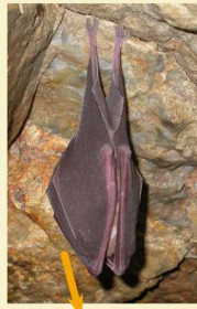
Grand rhinolophe en hivernage dans une ardoisière du Canal de Nantes à Brest

35 gîtes découverts par le GMB dans les galeries d'ardoisières à l'abandon regroupent en hiver 2000 Grands rhinolophes Rhinolophus ferrumequinum , soit environ la moitié des hivernants de Bretagne . Ce réseau se prolonge à l'Ouest par celui des blockhaus de la Presqu'île de Crozon.