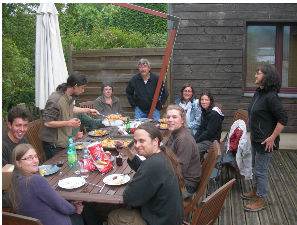
Une partie des troupes lors du repas du samedi soir