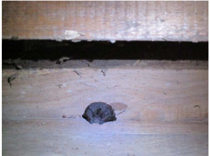
Barbastelle d'Europe