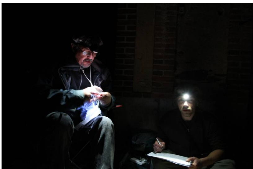
Capture de Chiroptères