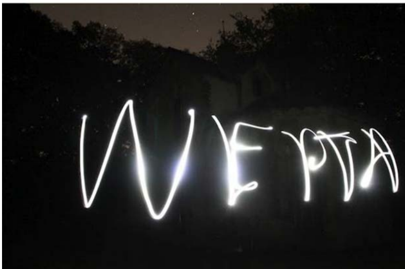
Week-End de Prospections Tous Azimuts