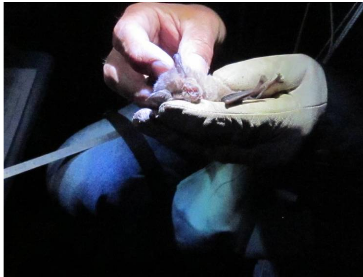
Grand rhinolophe capturé