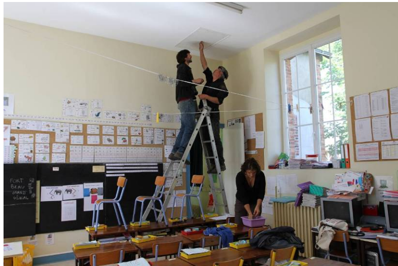
Prospections de bâtiments