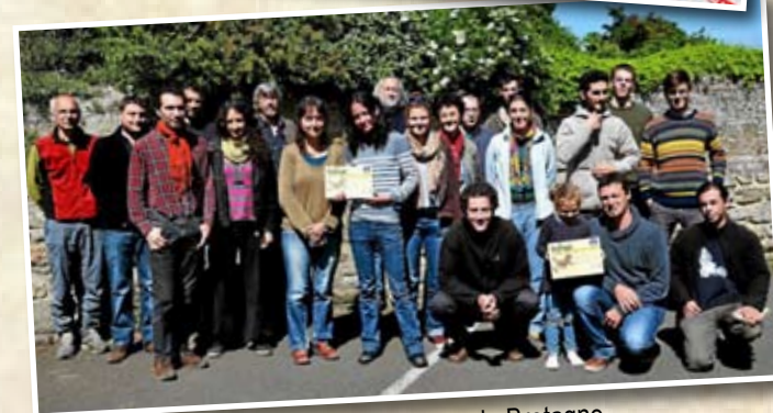
Rencontre des médiateurs mammifères de Bretagne, Saint-Glen (22), mai 2015