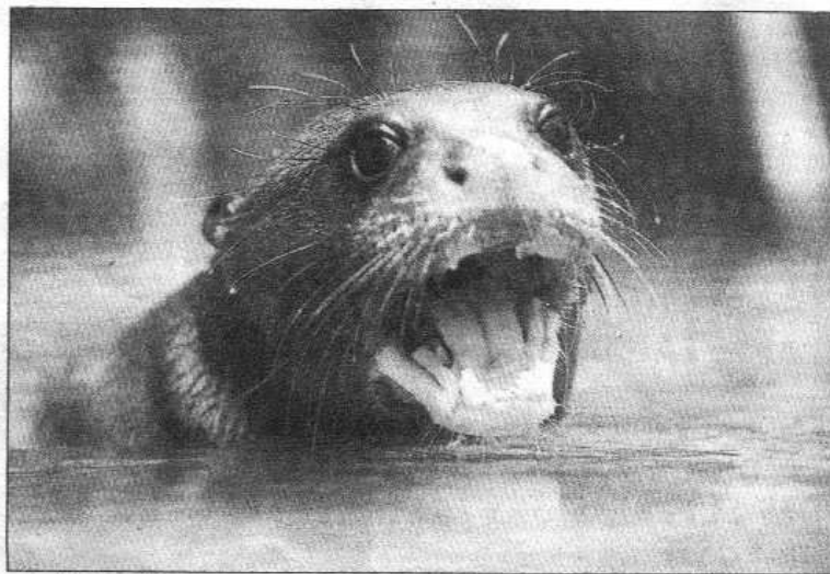
● Deux familles d'Arzano et de Guillegomarc'h ont décidé d'aménager les berges qui longent leur propriété, afin de faciliter le retour de la loutre d'Europe sur l'Ellé et le Scorff.

Mais ô miracle, de récents inventaires réalisés par le GMB, le Groupement mammalogique de Bretagne, ont permis également de remonter sa trace sur l'Ellé et le Scorff.