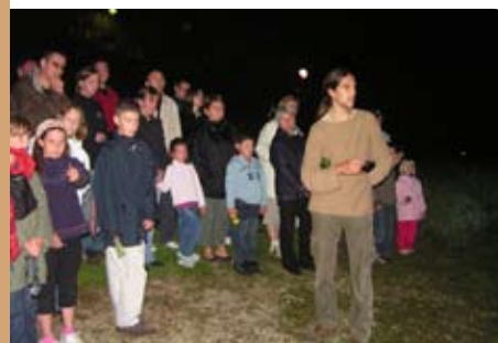
Nuit Européenne de la Chauve-souris

● Réalisation d' animations tous publics : Nuits de la Chauve-souris (dernier week-end d'août), Fête de la Nature etc.