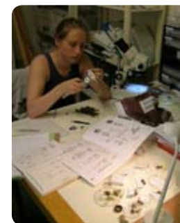
Etude des micromammifères par l'analyse de pelotes de réjection de Chouette Effraie