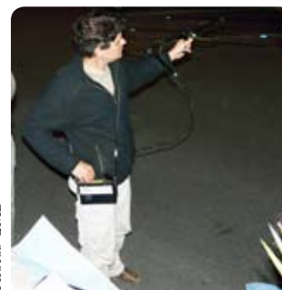
Etude des terrains de chasse de chauves-souris par radiopistage