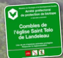
Panneau d'Arrêté Préfectoral de Protection de Biotope