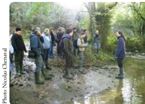
Formation mammifères semi-aquatiques pour des professionnels