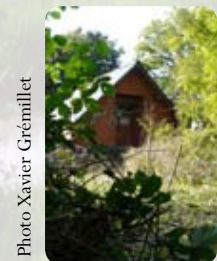
Bâtiment construit en 2006 pour les mammifères sauvages