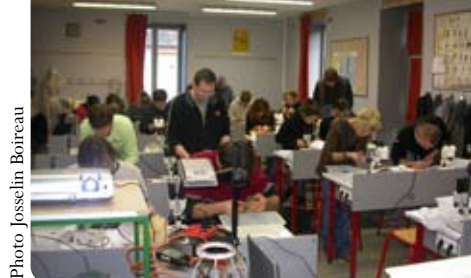
Stage « micromammifères » à destination des adhérents

+ de nombreux documents sur le site du GMB !