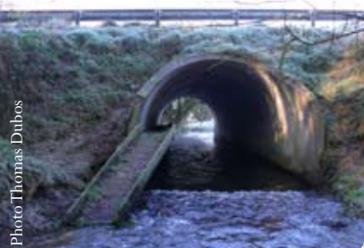
Passage à Loutre