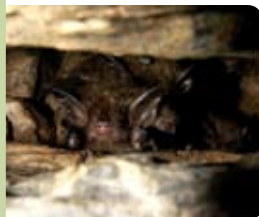
Murin de Daubenton