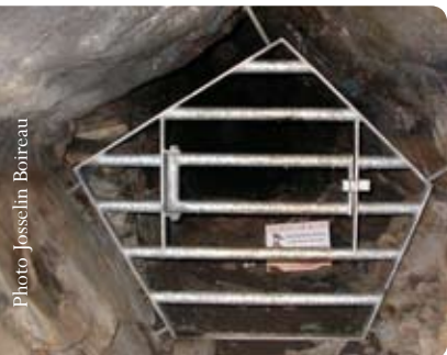
Grille de protection d'un gîte à chauves-souris