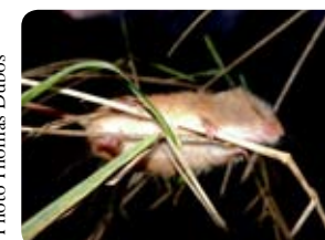
Rat des moissons

"Souterrain, terreste, aquatique, pygmée..." autant de noms qui désignent les nombreux petits rongeurs et insectivores de la faune bretonne. Les mulots, rats, musaraignes et autres campagnols sont aussi appelés "micromammifères". Les uns se nourrissent d'insectes, de lombrics, les autres de graines et de végétaux. Certains creusent des terriers, d'autres construisent des nids dans les champs ou au bord des cours d'eau. Toutes ces espèces ont un taux de reproduction élevé... Mais beaucoup de jeunes et d'adultes sont la proie des renards, chats, fouines, belettes, faucons, chouettes... Leur observation est très difficile en milieu naturel en raison de leurs moeurs discrètes et de leur petite taille. Celle-ci varie selon les espèces de 5 à 26 cm pour un poids de 5 à 450g. Leur recensement se fait donc soit par la pose de pièges et la capture de l'animal vivant, soit par une analyse des restes osseux trouvés dans les pelotes de rejection des rapaces. En Bretagne, il a été dénombré 17 espèces différentes. Ces animaux méconnus requièrent toute notre attention. Certaines espèces ont vu leur nombre diminuer, conséquence directe de la modernisation agricole, de la destruction du bocage, des zones humides et de l'utilisation de biocides.