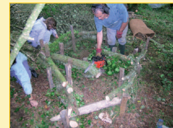
Chantier de construction de catiches artificielles sur un Havre de Paix