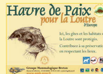
Panneaux (format A3) annonçant l'existence d'un Havre de Paix pour la Loutre.