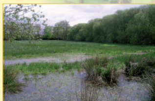
Mare favorable à l'alimentation de la Loutre.