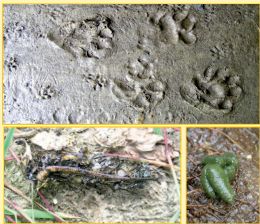
Empreintes et épreintes de Loutre, crottes de Campagnol amphibie.

Plus que les observations directes, rarissimes dans le cas d'espèces très discrètes comme la Loutre, ce sont les indices de présence qui vous renseigneront sur les hôtes de vos berges et leurs habitudes.