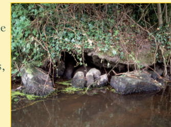
Catiche naturelle, gîte de la Loutre