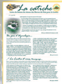
La Catiche, bulletin de liaison du réseau des Havres de Paix