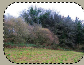
Derc'hel strouezh lez ar c'hoadoù.