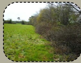
Merañ ar girzhier evit ma vefent ledan ha liesseurt.