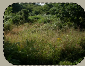
Krouiñ tachennoù dieub evit an adnevezadur naturel (digoadennoù).