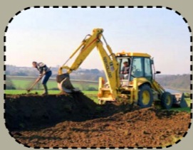
Derc'hel pe adkrouiñ ur c'harzhaoueg stank.