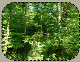
Merañ koadoù gwez deliek lies oad, gant koad-dindan ha tachennoù laosket da goshaat.

Hiniennoù, aozerien an tiriad ha strolladoù lec'hel a c'hall skoazellañ ar Grilian hag ar bevliessourted dre vras :