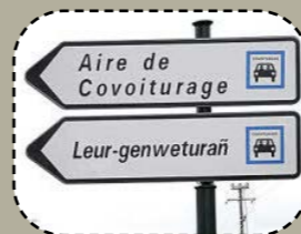
Kemer perzh, e-giz emañ posubl, e stourm a-enep ar cheñchamant hin.