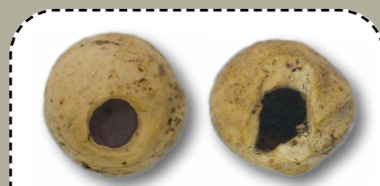
Kalonnennoù babu krignet gant ur Grilian (a gleiz) ha gant ur vorzigellenn pe ur vuenn (a zehoù).

An aesañ d'ober zo klask restajoù kraoñ-kelvez pe kalonnennoù babu, rak un doare ispisial zo gantañ da debriñ. Posubl eo kavout un neiz ivez.