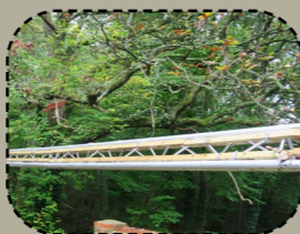
Sevel arroudennoù evit al loened vihan dreist an hentoù implijet kalz.