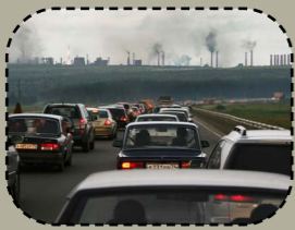
Cheñchamant hin (a ampech outañ da goañvaat).