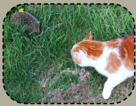
Preizhet int gant ar c'hizhier (doñvet pe aet da ouez).