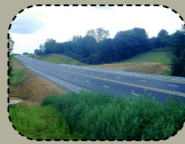
Dispartiet e lec'h bevañ (hentoù...)