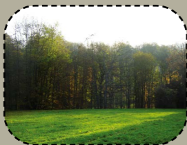
Diskar strouezh lez ar c'hoadoù.