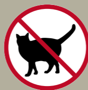
Harzañ kresk poblañs ar c'hizhier doñv e pep lec'h en natur.