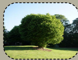
Plantañ spesadoù gwez deliek eus ar vro (kraoñ-kelvez en o zouez).