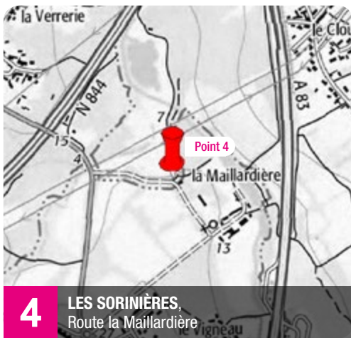
4 LES SORINIÈRES, Route la Maillardière