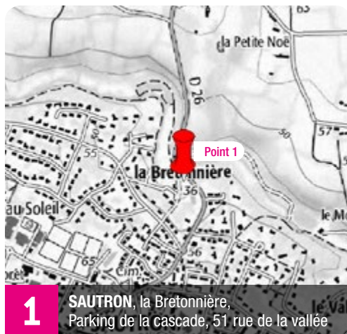
1 SAUTRON, la Bretonnière, Parking de la cascade, 51 rue de la vallée