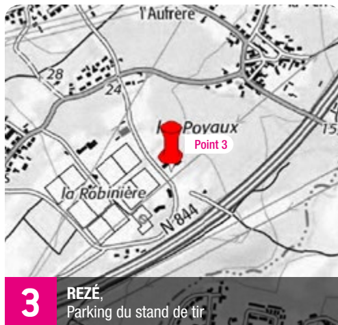
3 REZÉ, Poyaux, Parking du stand de tir