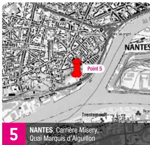
5 NANTES, Carrière Misery, Quai Marquis d'Aiguillon

Les prix du concours photo organisé dans le cadre de cet événement seront remis aux lauréats le samedi 9 juin lors de l'événement « Aux Arbres ! »