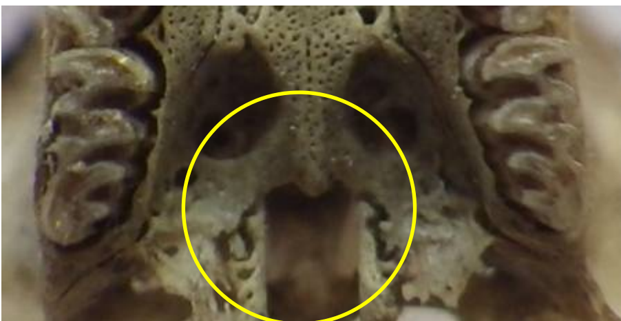
Campagnol des champs Microtus arvalis

Le palais se termine en forme d'accolade avec la pointe dirigée vers l'avant.