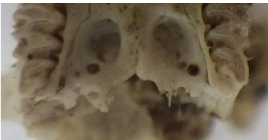
Campagnol des champs Microtus arvalis atypique

Le palais se termine par une courbe dont le sommet est dirigé vers l'avant, mais qui est interrompue en son milieu par une protubérance dirigée vers l'arrière.