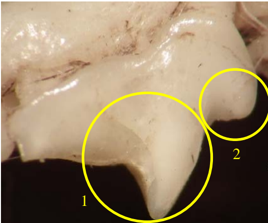
Crocidura leucode Crocidura leucodon

La cuspide (1) est accolée au métacone (2). Le cingulum (3) forme une ogive peu prononcée, il est massif, très épais.