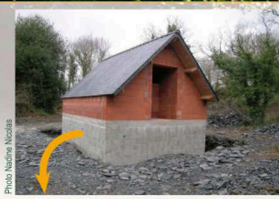
Vue de l'étage «hivernage» avant remblaiement.

Sous-sol obscur semi-enterré pour des conditions fraîches et stables en hiver (unique accès par une trémie dans la dalle de béton du niveau supérieur). Murs en parpaings recouverts de remblais.