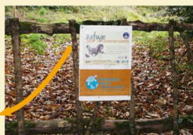
Barrière construite par les bénévoles