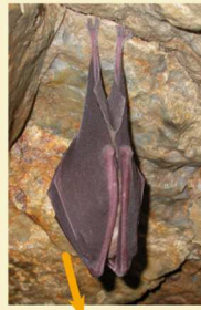
Grand rhinolophe en hivernage dans une ardoisière du Canal de Nantes à Brest

35 gîtes découverts par le GMB dans les galeries d'ardoisières à l'abandon regroupent en hiver 2000 Grands rhinolophes Rhinolophus ferrumequinum , soit environ la moitié des hivernants de Bretagne . Ce réseau se prolonge à l'Ouest par celui des blockhaus de la Presqu'île de Crozon.